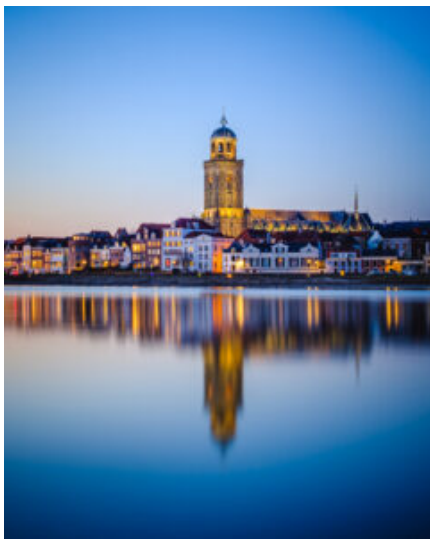
Skyline van Deventer met toren van de Lebuïnus kerk

Deventer is een stad met een rijke historie en de grootste kerk, de Grote of Lebuïnus-kerk, gebouwd in de periode 1450-1525, wordt het centrale punt voor de najaarsbijeenkomst met lezingen, workshops, informatiemarkt en de ALV. De kerk is ook een mooi startpunt voor een paar fraaie stadswandelingen.