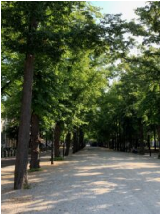
Voorhout Den Haag