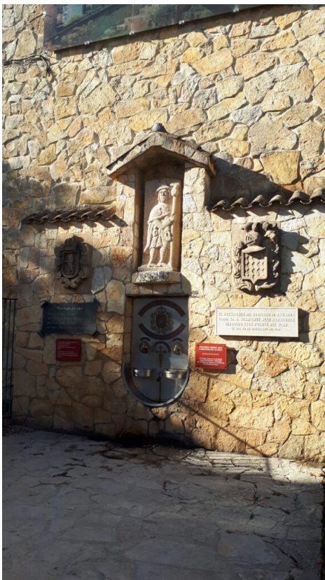
Wijnfontein bij Irache

Uiteraard ga ik er discreet mee om en zal ik in mijn verhaal slechts onherkenbaar verwijzen naar de inzender van een ervaringsverhaal.