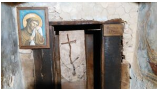
Kloostertje buiten Greccio, slaapplek Franciscus

Op zaterdag 15 oktober organiseert de pelgrimsherberg van 10-16 uur een themadag die geheel in het teken staat van Franciscus. We maken twee wandelingen, waarbij op bijzondere en lichtvoetige wijze een kernwoord van die vrolijke Frans centraal staat. Op deze dag zijn dit 'eenvoud' en 'vertrouwen'. Woorden die elke wandelaar, of die zich pelgrim voelt of niet, kent en ervaart. Ook luisteren we naar zijn levensverhaal, zien we beelden van zijn woonplaats en leren hem op die manier wat beter kennen.