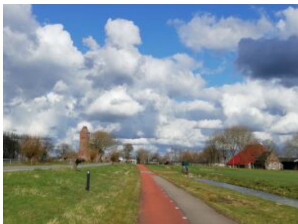
Het kerkje van Swichum