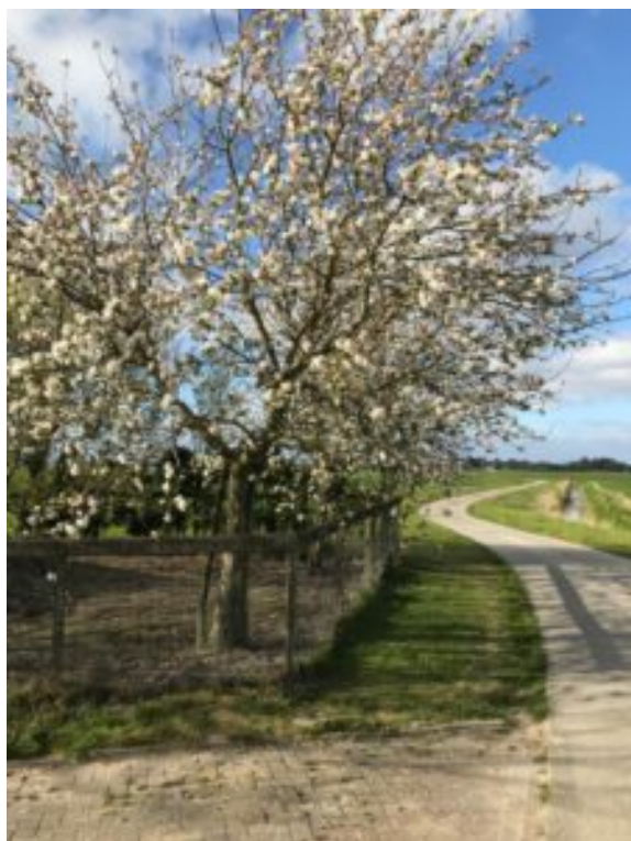
Jacobs appelboom, vast punt bij Pelgrimeren voor de Jeugd in Regio Fryslân

Op woensdagmiddag 2 maart 2022 organiseren we een voorbereidings-/kennismakingsbijeenkomst in Sint Jacobiparochie.