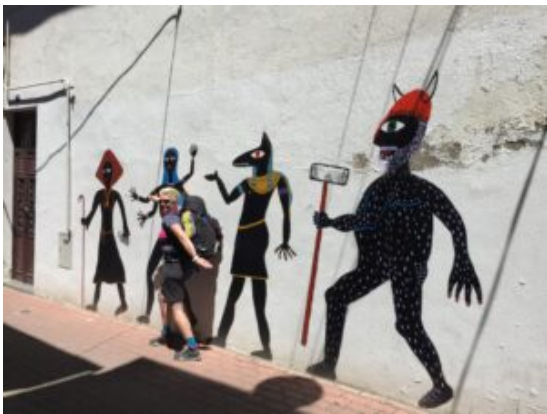
Walk like an Egyptian

Toen vertelde een vriendin me over haar camino naar Santiago de Compostela. De foto's, haar twinkeloogjes toen ze erover vertelde, de rust die ze uitstraalde, dat wilde ik ook. Als ik iets wilde gaan doen moest ik niet excuses zoeken maar mogelijkheden uitzoeken. Het zaadje was geplant. In maart 2016 vertelde ik mijn partner: 'Ik heb een vlucht geboekt'. En haar simpele antwoord was: 'hèhè!'. Ik had voor het eerst in tijden een doel waar ik ontzettend naar uitkeek. Mijn camino was in één woord geweldig en je snapt dat als ik hierover vertel en foto's laat zien, ik straal!