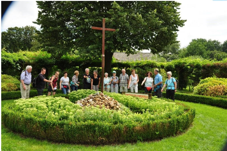
Impressie van de Jacobuswandeling

De Camino in de Kempen komt er alweer aan. Op 25 juli a.s. wordt er gewandeld door de mooie natuur van Vessem, Wintelre en Hoogeloon. We hebben dit jaar gekozen voor twee nieuwe routes rondom Vessem. Het belangrijkste van deze dag is het met elkaar wandelen. Als extra worden er tijdens deze tocht herinneringen opgehaald van het pelgrimeren naar Santiago de Compostela. Ook plaatselijke bezienswaardigheden spelen een rol tijdens het lopen.