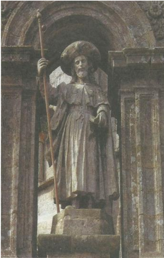
Jacobus verhuisde naar de voorzijde van de pas

Vorig jaar kwam het kapittel van de kathedraal van Santiago de Compostela met nieuwe eisen voor de pelgrimspas waarmee pelgrims een compostela komen halen in het pelgrimskantoor. Eén van die eisen is dat de pas moet zijn voorzien van de tekst: El sepulcro del Apóstel de la Catedral de Santiago, meta de la Peregrinación Jacobea (vertaald: Het graf van de apostel van de kathedraal van Santiago, doel van de Jacobijnse bedevaart ). Als tijdelijke oplossing mocht er op de pas voor leden van het Genootschap een sticker met deze tekst geplakt worden.