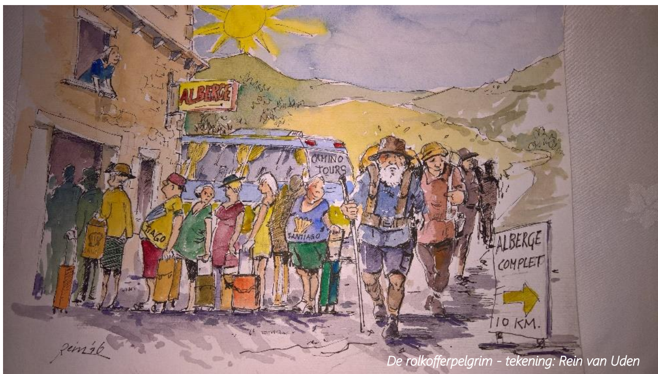
De rolkofferpilgrim - tekening: Rein van Uden

Via deze link is een onlangs bijgewerkte gratis gids van de Via de la Plata te downloaden. De site vraagt om een mailadres en vervolgens krijg je een link om de pdf te downloaden. De gids bevat geen kaartmateriaal, maar geeft een routebeschrijving van Sevilla naar Salamanca en informatie over de onderkomens onderweg.