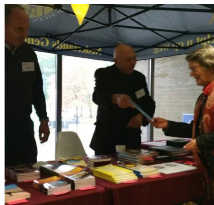
De vrijwilligers van de Ledenservice van het Genootschap: altijd present om informatie te verschaffen.