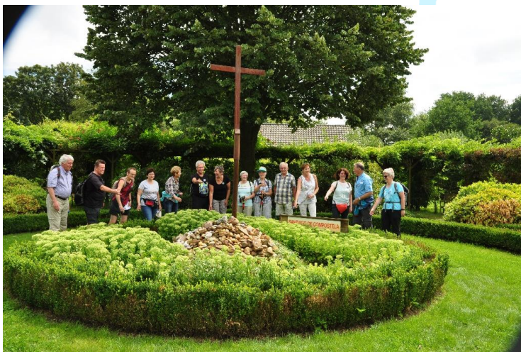
Impressie van de Jacobuswandeling

Inschrijven voor de tocht kan tot 18 juli op de website van de Jacobushoeve www.jacobushoeve.nl ("Camino in de Kempen" aanklikken) en op de website van Pelgrimshoeve Kafarnaüm www.pelgrimshoevekafarnaum.nl ("Aanmeldformulieren" –"Jacobuswandeling" aanklikken). De kosten bedragen € 7,50 per persoon, enkel contant te voldoen ter plaatse voor het vertrek van de wandeling.