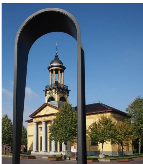
De Groote Kerk, eindpunt van de estafette

Basis voor de te lopen routes vormen de beschrijvingen uit de twee boekjes 'Jacobswegen in Nederland'. De organisatie van de trajecten is in handen van de regiogroepen. De camino start in februari 2018 in de meest zuidelijk gelegen regio's van de routes. Elke daarop volgende maand wordt het stokje doorgegeven aan de volgende regio. Elke regio heeft dus een maand de tijd om het stuk Jacobsweg door haar gebied te realiseren.