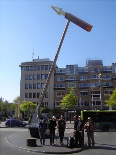
De grootste gele pijl van Nederland op het stationsplein van Amersfoort

Een impressie van de landelijke voorjaarsbijeenkomst van 21 maart jl. kunt u lezen op onze website .