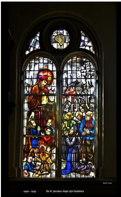
Glas-in-lood-raam in Jacobskapel Haarlem

Voor velen is Haarlem een haltepunt op hun pelgrimage naar Santiago de Compostela. Voor veel fietsers die de routeboekjes St. Jacobsfietsroute van Clemens Sweerman gebruiken, fungeert de Jacobskapel in het voormalige Jacobs Godshuis als symbolisch startpunt van hun tocht. Om deze start of het bereiken van het etappedoel extra aandacht te geven, zijn vrijwilligers van het Genootschap uit de regio Bollenstreek-Rijnland op afspraak beschikbaar om de (eerste) stempel in het pelgrimspaspoort te zetten. Pelgrims worden ontvangen met een kop koffie of thee en er is gelegenheid om de Jacobskapel van het voormalige Jacobs Godshuis te bezoeken en andere jacobalia te bezichtigen in en om het huis.