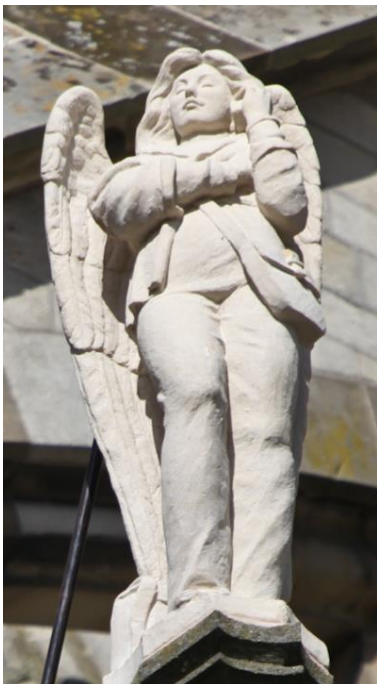
Bellende engel op de Sint-Jan in Den Bosch.

Van de universiteit van San Francisco ontvingen we het verzoek om deze oproep te plaatsen. De vragenlijst is in de Engelse taal en het invullen kost ongeveer 20 minuten.