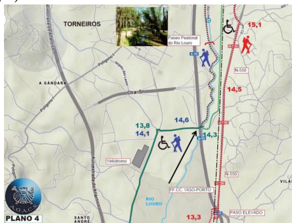
Tweede cruciale splitsing, direct na passage van de A55

Voor beide kaartjes geldt: blauw: aanbevolen aantrekkelijke route, rood: oude route langs industrieterrein en N-550. groen: traject geschikt voor rolstoelen (voor een uitgebreide beschrijving in het Engels zie orbenlle-porrino-eng.pdf )