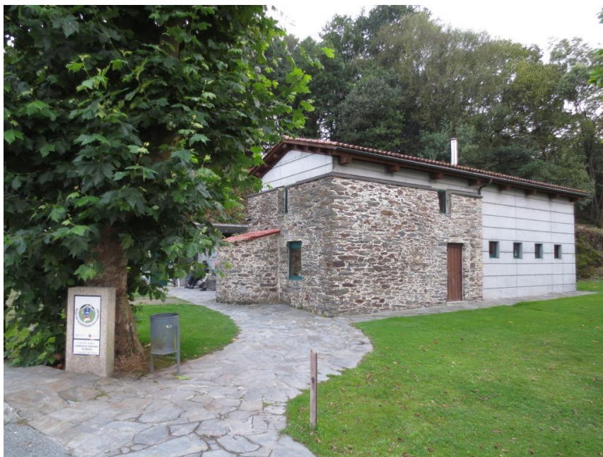
Albergue in Bruma (Camino Inglés)

Deze herbergen worden gerund door een beheerder met wie de vrijwilliger samenwerkt. De taken van de hospitalero bestaan uit het gastvrij ontvangen van en steun verlenen aan pelgrims tijdens de openingstijden van 13 tot 22 uur. Schoonmaken wordt uitbesteed. Talenkennis, vooral een beetje Spaans, is handig. Het werk is op vrijwillige basis. Reis- en maaltijdkosten zijn voor eigen rekening. De vrijwilliger beschikt over een eigen kamer met toilet tijdens het verblijf in de herberg. Er wordt voorzien in een verzekering voor alle vrijwilligers. Vrijwilligers mogen zich alleen of met zijn tweeën opgeven.