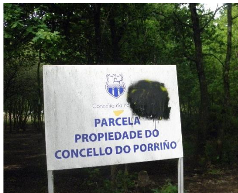
Gele pijlen worden letterlijk zwart gemaakt.

Het zint de horeca langs de onaantrekkelijke oude route niet dat pelgrims een wandeltocht door een fraai stuk natuur wordt aangeboden. ‘Goede’ gele pijlen worden letterlijk zwart gemaakt (zie afbeelding 1) en er worden misleidende gele pijlen op het wegdek aangebracht. Cruciale plekken, aangegeven met zwarte pijlen in de afbeeldingen, op de route zijn Orbenlle (afbeelding 2) en de afslag vóór de rivier de Louro bij de passage van de A55 (afbeelding 3).