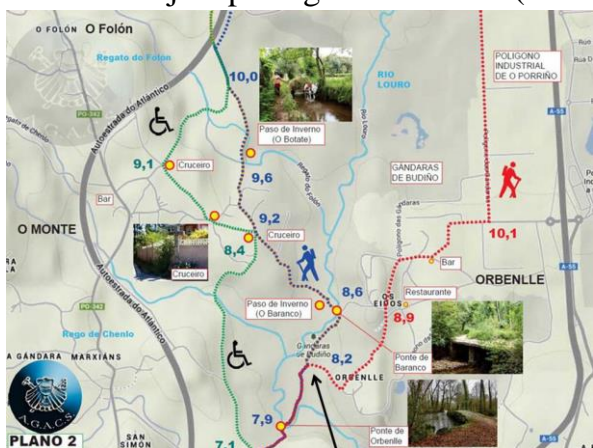
Eerste cruciale splitsing bij Orbenlle