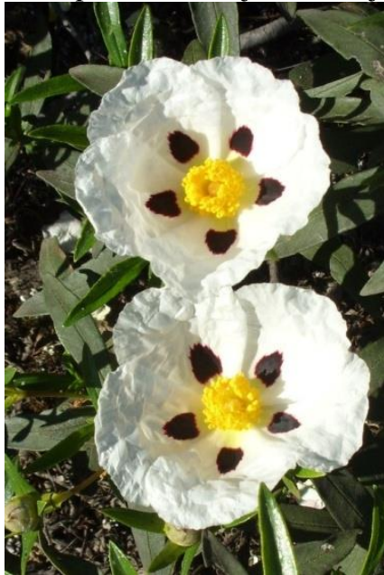
Flor de la Jara: mooiste zonneroosje en symbool van de route

Bijgaand de definitieve uitnodiging voor het lezen van de beschrijving van de Camino Mozarabe. Van deze route is niet veel bekend, maar met beschrijving is het goed te doen. Vooral pelgrims die nogal eens klagen over de volle Camino Francés kunnen hier hun hart ophalen, want je komt bijna niemand tegen.