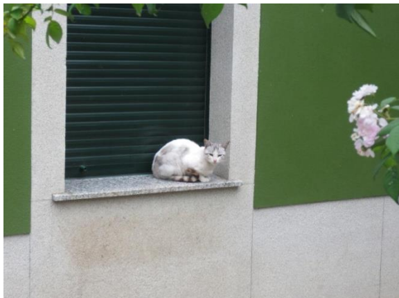
Poes langs Camino Inglés

Hoofdredactie: André Brouwer Redacteur: Paul Kouwenberg Redactieadviseur: Monique Walrave Vormgeving: André Brouwer en Han Pronker Verzending: Han Lasance