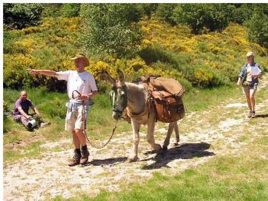
Nee, mag niet meer, omlopen

Maar ook geen lama's, ezels, paarden en fietsen op de Via Podiensis tussen Nasbinals en Aubrac (5 km). De eigenaars willen dit niet meer en het staat ook in een nieuw gemeentelijk reglement.