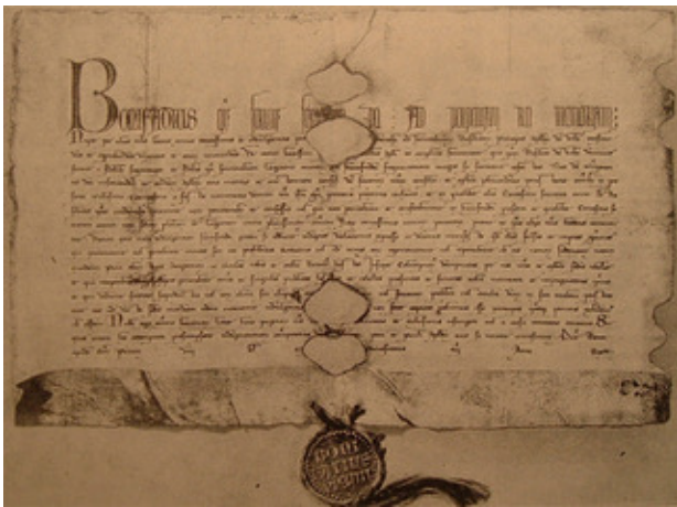
Pauselijke bul over 'Heilige Jaren'

, met fascinerende details, geestig, met toespelingen en parodieën en met groot ontzag voor heiligen en hun relieken. Het leest als een propagandaboek voor het pelgrimeren naar Jacobus' graf in Santiago de Compostela.