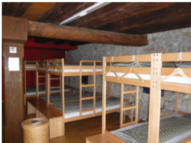
2020 – pelgrimeren en besturen binnen de coronabeperkingen

Intussen bewaart het bestuur de verzamelde informatie en – zodra we weer veilig bij elkaar kunnen komen – zullen er nieuwe bijeenkomsten worden gepland om daarin met elkaar het gesprek aan te gaan. Wordt dus vervolgd.