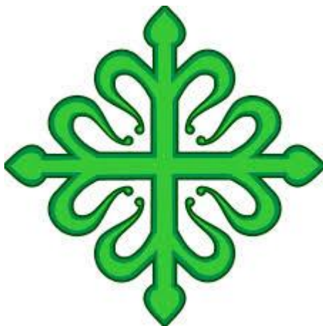
Orde van Alcantara