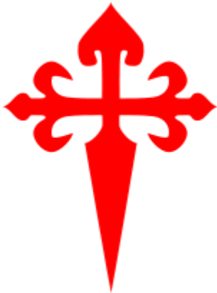
Orde van Santiago

uit van een kloostercomplex; men heeft graven gevonden. Tegenwoordig wordt vrij algemeen aangenomen dat kerkje behoorde het tot de Orde van de Tempeliers dan wel tot de Orde van San Juan. De naam Eunate is Baskisch voor 'honderd poorten'.