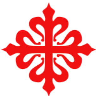
Orde van Calatrava