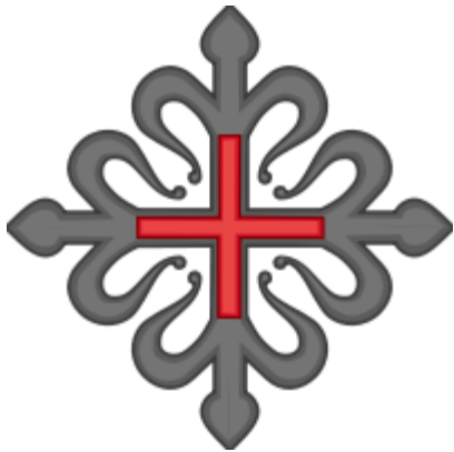
Orde van Montesa