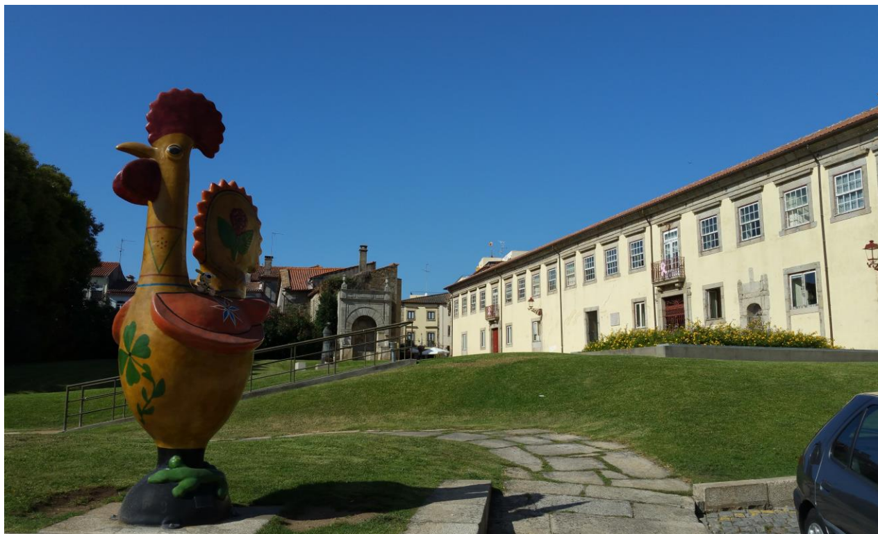
Camino portugués, Barcelinhos