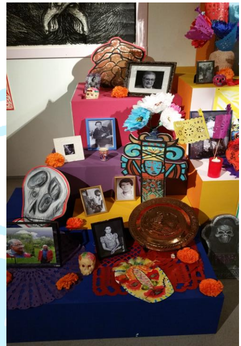
Altaar voor Día de los Muertos, Mexico

Voor meer info en aanmelden: www.santiago.nl/GenC-Home