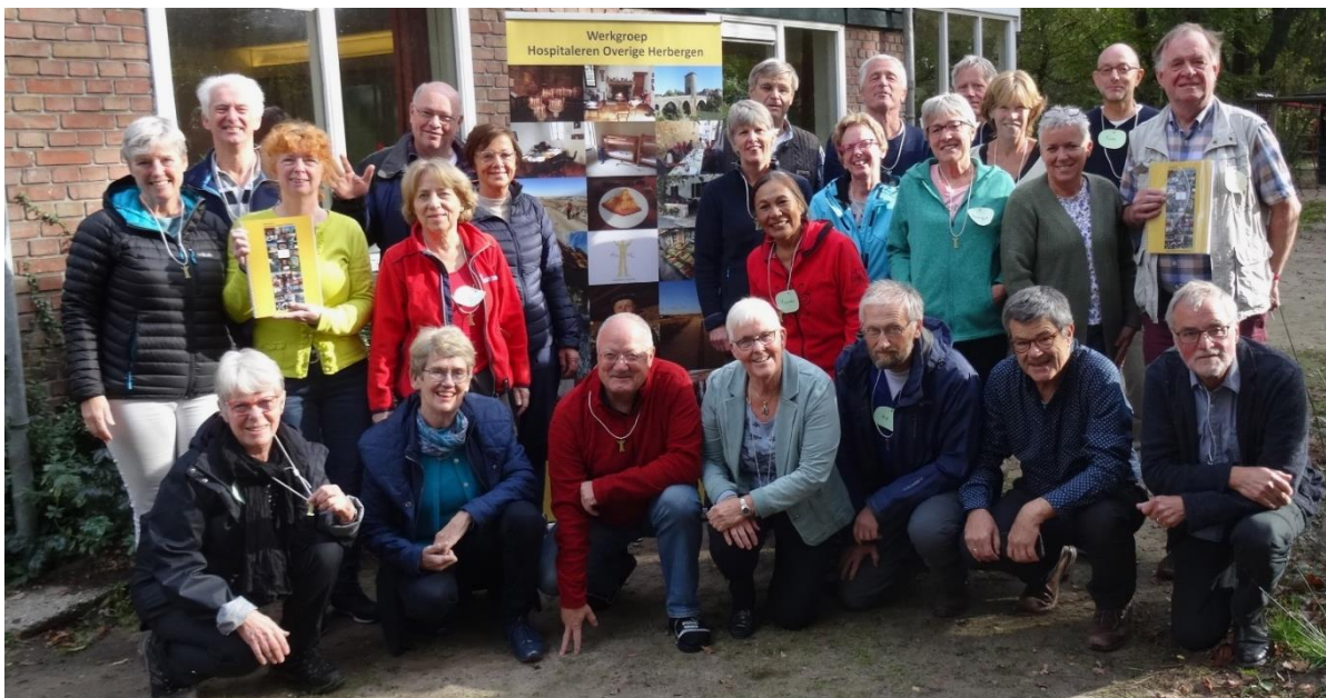
Van de Werkgroep Hospitaleren overige Herbergen

Wil je ook hospitaleren en een cursus volgen? We hebben het NIVON huis in Buurse weer besproken voor 15 - 17 november 2019.