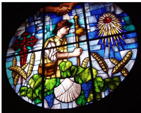
Glas-in-lood-raam en huiskamer Albergue Grañon