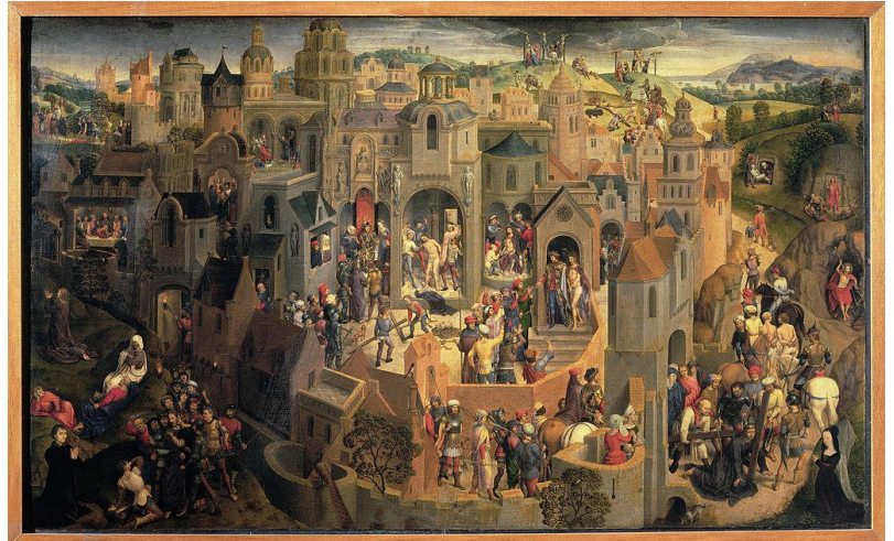
Hans Memling: Passie van Christus . Besproken tijdens de Camino Academie

De vorige Ultreia begonnen we met de opmerking van sommige lezers dat de Ultreia zo uitgebreid is. Dit leverde weer reacties op van mensen die hem juist weer kort vonden. Daarom dit keer een dikke kerst-Ultreia.