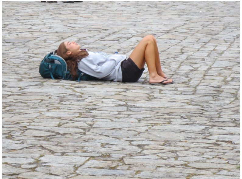
Rust voor de kathedraal op de Praza do Obradoiro.

Regelmatig horen we: “Ja, interessant die Ultreia, maar het is allemaal zo veel.”