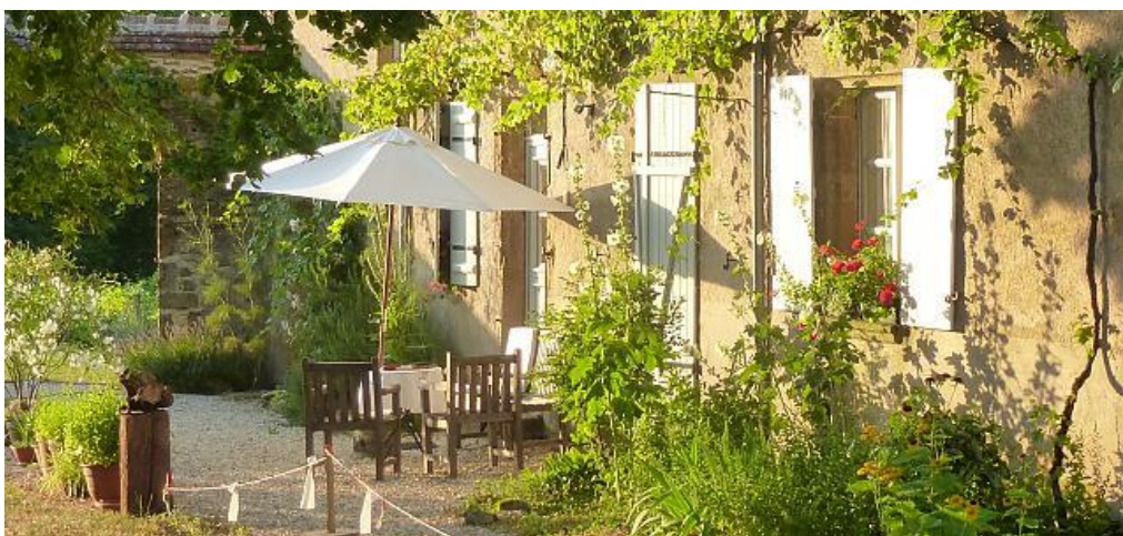
Foto: de nieuwe herberg in Le Chemin