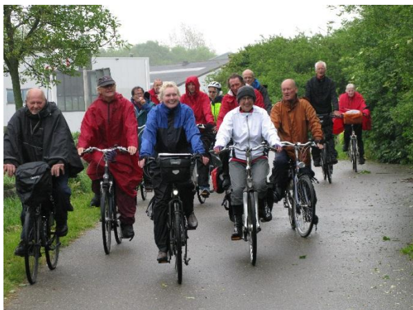
Foto: Fietstocht regio Den Haag