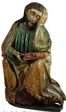
Jacobus, detail van Christus in de hof van Grossehaene Worms?, ca. 1440. ABM bh567-570

Lezers die zelf ook schrijven kunnen in deze rubriek hun boek onder de aandacht van de leden van ons genootschap brengen (het is dus geen recensie van de redactie van Ultreia ).