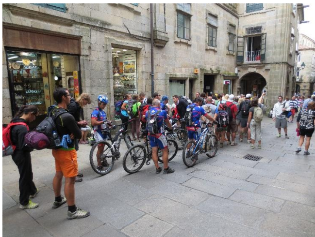
Foto: rij voor het pelgrimsbureau in Santiago

Het pelgrimeren wordt alsmear populairder. Zondag 13 oktober jl. liet de 200.000 e pelgrim van dit jaar zich registreren in het Pelgrimsbureau in Santiago. Ter vergelijking: in heel 2012 waren dat er 192.488. Men verwacht dat het totaal voor 2013 uit gaat komen op 216.000. Dat zou (afgezien van het heilig jaar 2010 toen er zich 272.412 pelgrims lieten registreren) voor het eerst in de geschiedenis zijn dat men in een 'gewoon jaar' boven de grens van 200.000 uitkomt.