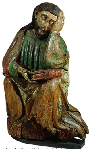
Jacobus, detail van Christus in de hof van Getsemane Worms?, ca. 1440 ABM bh567-570

Wij stellen het op prijs indien u een exemplaar van uw boek aan onze bibliotheek schenkt. Gaarne uw boek naar: Nederlands Genootschap van Sint Jacob t.av. Bibliotheek Janskerkhof 28a 3512 BN UTRECHT