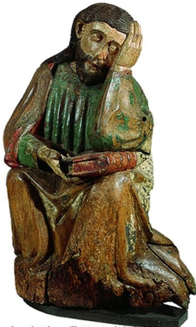
Jacobus, detail van Christus in de hof van Gethsemane Worms?, ca. 1440 ABM bh567-570

Veel van onze lezers pelgrimeren niet alleen, zij schrijven daarover. Schrijven is nog leuker als je werk ook gelezen wordt. We ontvangen regelmatig verzoeken van lezers of zij hun boek via de Ultreia onder de aandacht mogen brengen. We hebben besloten hier een aparte rubriek voor te openen, het pelgrimsboekenhoekje is inmiddels een flinke hoek geworden. Vandaar deze nieuwe titel.