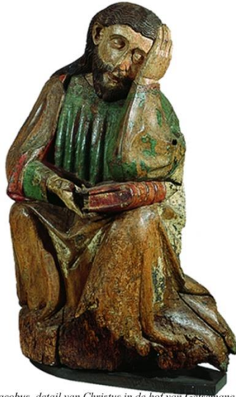
Jacobus, detail van Christus in de hof van Geisemane Worms?, ca. 1440 ABM bh567-570

Veel van onze lezers pelgrimeren niet alleen, zij schrijven daarover. Schrijven is nog leuker als je werk ook gelezen wordt. We ontvangen regelmatig verzoeken van lezers of zij hun boek via de Ultreia onder de aandacht mogen brengen.