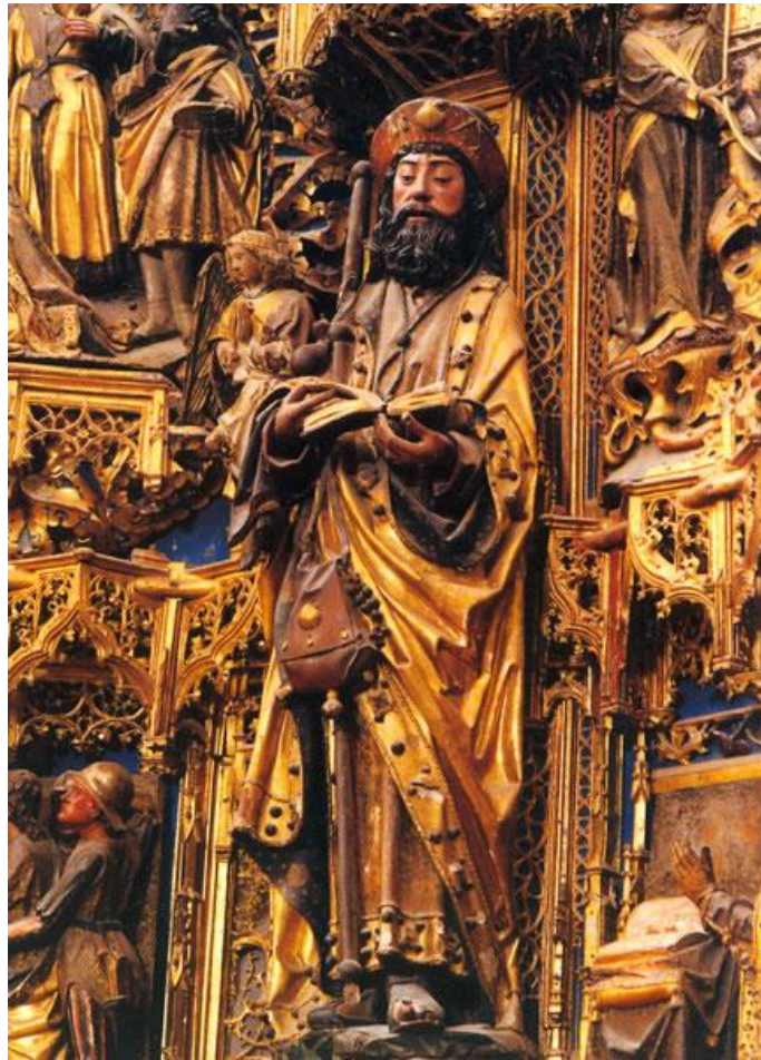
Beeld van Jacobus in het klooster van Miraflores (bij Burgos)

In tegenstelling tot eerdere berichten vindt de najaarsbijeenkomst van regio Noord-Holland benoorden 't IJ op 20 oktober niet plaats in de Blinkerd in Schoorl, maar in het Trefpunt, Louise de Colignystraat 20 te Alkmaar.