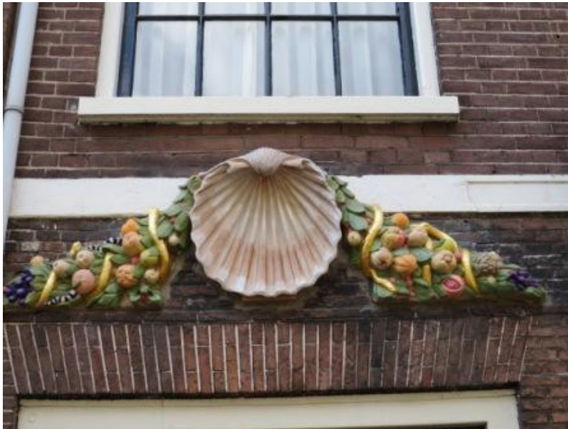
de (pas geschilderde) gevelsteen

Zaterdag 13 oktober is er een feestelijke open dag ter gelegenheid van het veertigjarig bestaan van het Rosenstock Huessy Huis dat de eeuwen daarvoor bekend stond als het Sint Jacobs Godshuis.