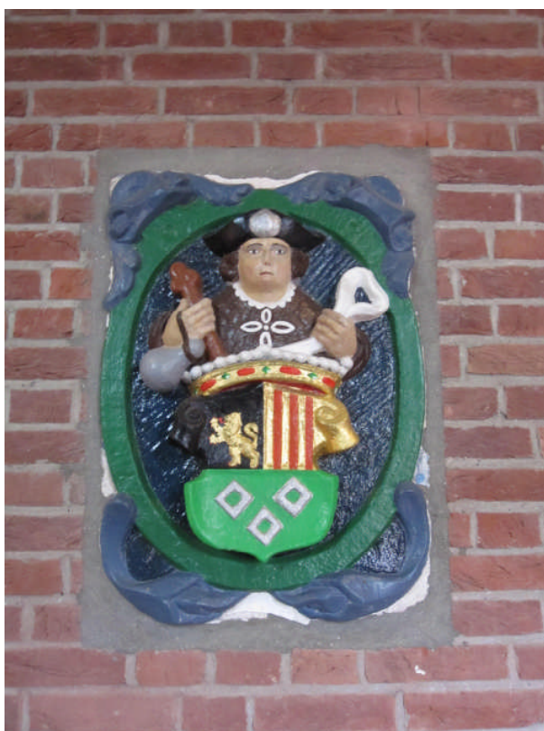
Sint Jacob boven het wapen van Fijnaart

Tip: zoekt u niet alleen in naar Jacobus genoemde kerken!