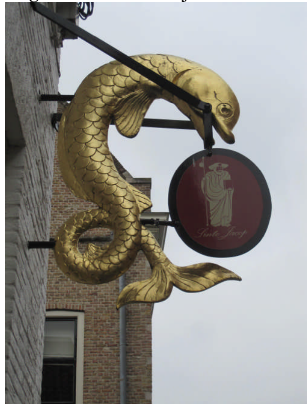
Sinte Jacop in Bergen op Zoom

Momenteel staan er ongeveer twintig muurschilderingen op de lijst, waarvan vijftien in Gelderland. Je zou mogen veronderstellen dat er ook in andere provincies nog vele, ons nu nog onbekende muurschilderingen van Jacobus zijn.