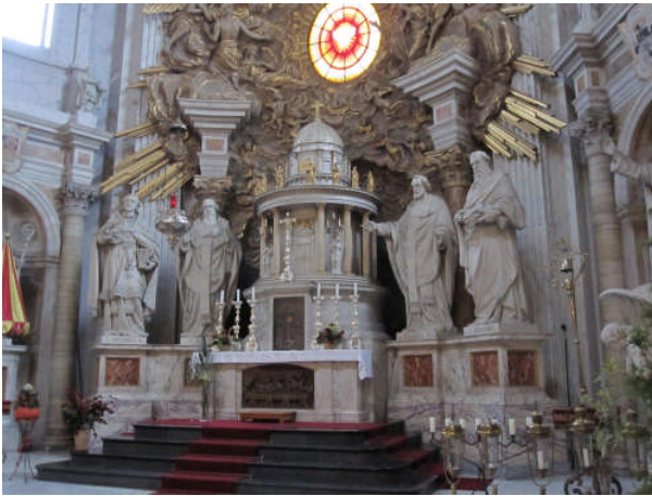
Basiliek van Oudenbosch