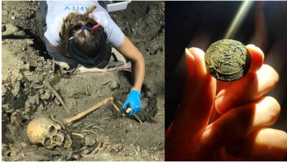
Het lijk van de Spaanse soldaat en de knop die het regiment heeft geïdentificeerd waartoe hij behoorde.