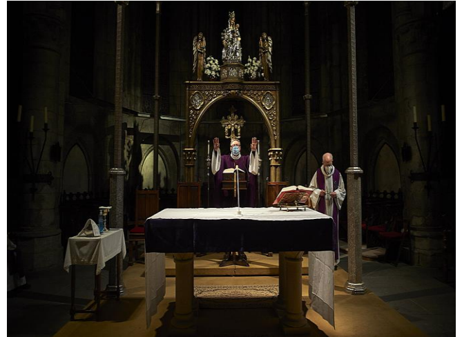
Om 23.00 uur begint de avondklok en