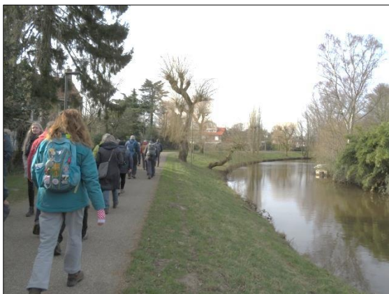
De Mark door het centrum van Breda