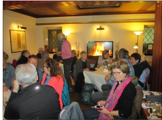
Bezoek aan de Heeren van Oranje