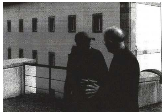
Persoonlijke aandacht voor een pelgrim

Daarnaast doen we in de zomer ook een beroep op de Spaanse scouting om ons in juli en augustus te komen helpen bij de opvang van pelgrims, die in het kampement overnachten.