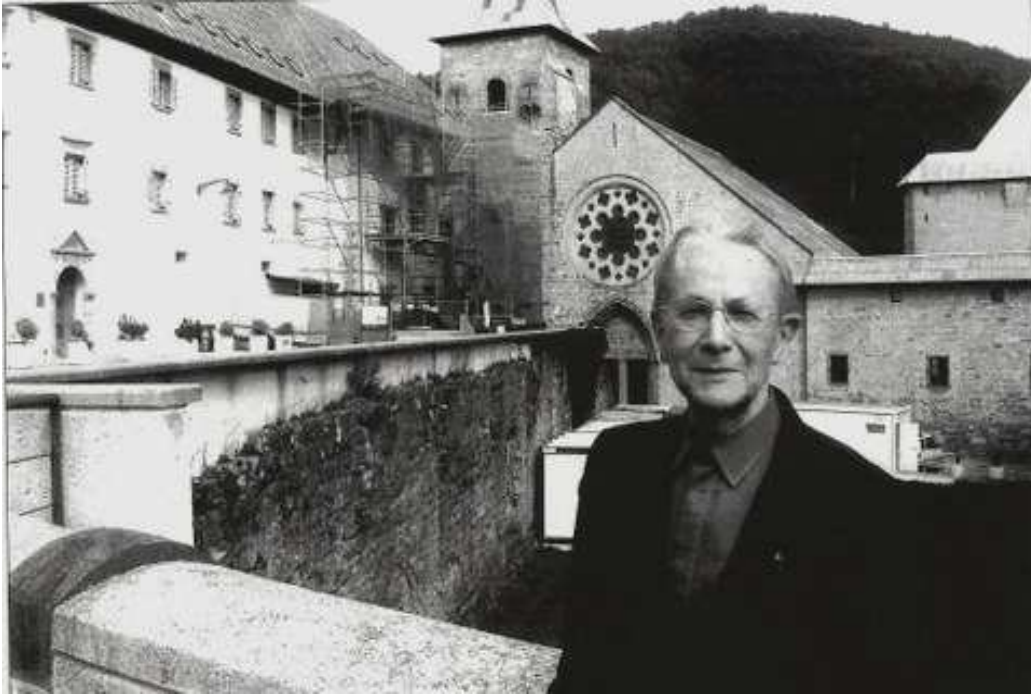
De Prior voor zijn 'Colegiata'